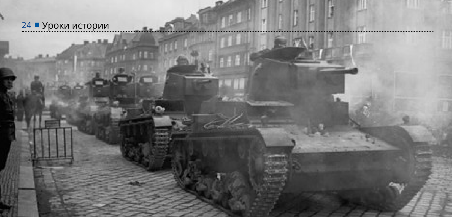
Польские танки 7TP входят в чешский город Тешин (Цешин). Октябрь 1938 года