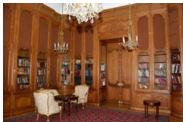
Дворец Печек у Стромовки – ныне посольство России

Изящный стиль дворца - неоклассицизм - сочетание стилей разного времени, значения и характера в одном объекте. Его основой стал романтизм с философией свободного перемещения в историческом времени и отказом от строгих канонов в искусстве. Роскошь, застывшая в архитектуре – именно так кратко и точно можно описать дворец Печек. Влияние французской архитектуры читается во всем здании - вынесение боковых ризалитов на стык главного корпуса