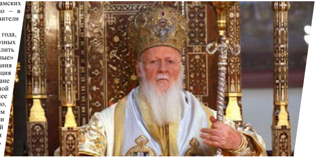
Патриарх константинопольский Варфоломей