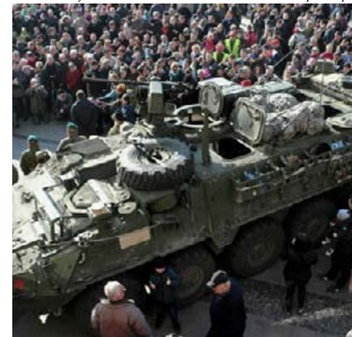
Американский конвой в Праге, 2015 г.

V NATO se čeští vojáci specializují v otázkách ochrany před zbraněmi masového ničení. Proslulá elitní jednotka českých ozbrojených sil – 31. brigáda radiční, chemické a biologické obrany se aktivně účastní různých zahraničních misí. Další specializací českých vojáků v alianci je pasivní sledování vzdušných a námořních cílů. V této oblasti má Česko k dispozici i prů-