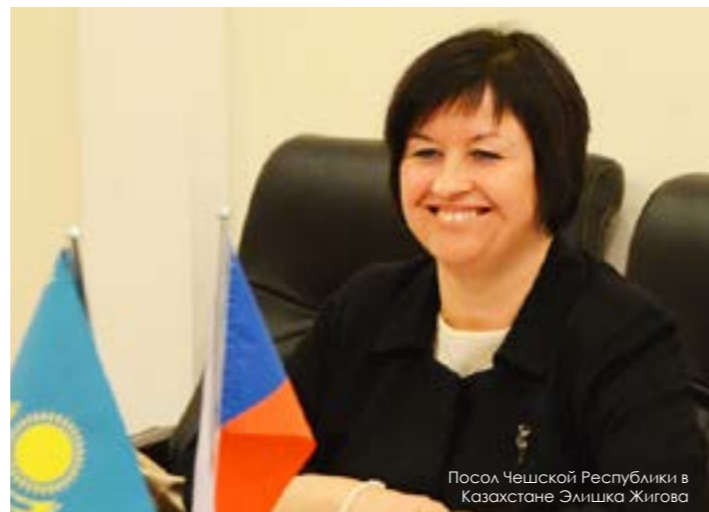
Посол Чешской Республики в Казахстане Элишка Жигова

Общепризнаны успехи чешских хоккеистов. Именно поэтому опыт европейской страны пригодится в создании детского хоккейного модуля и Ледового дворца, который планируется возвести на основе государственно-частного партнерства. Как прозвучало на встрече, поставщиками специализированного оборудования станут словацкие производители.