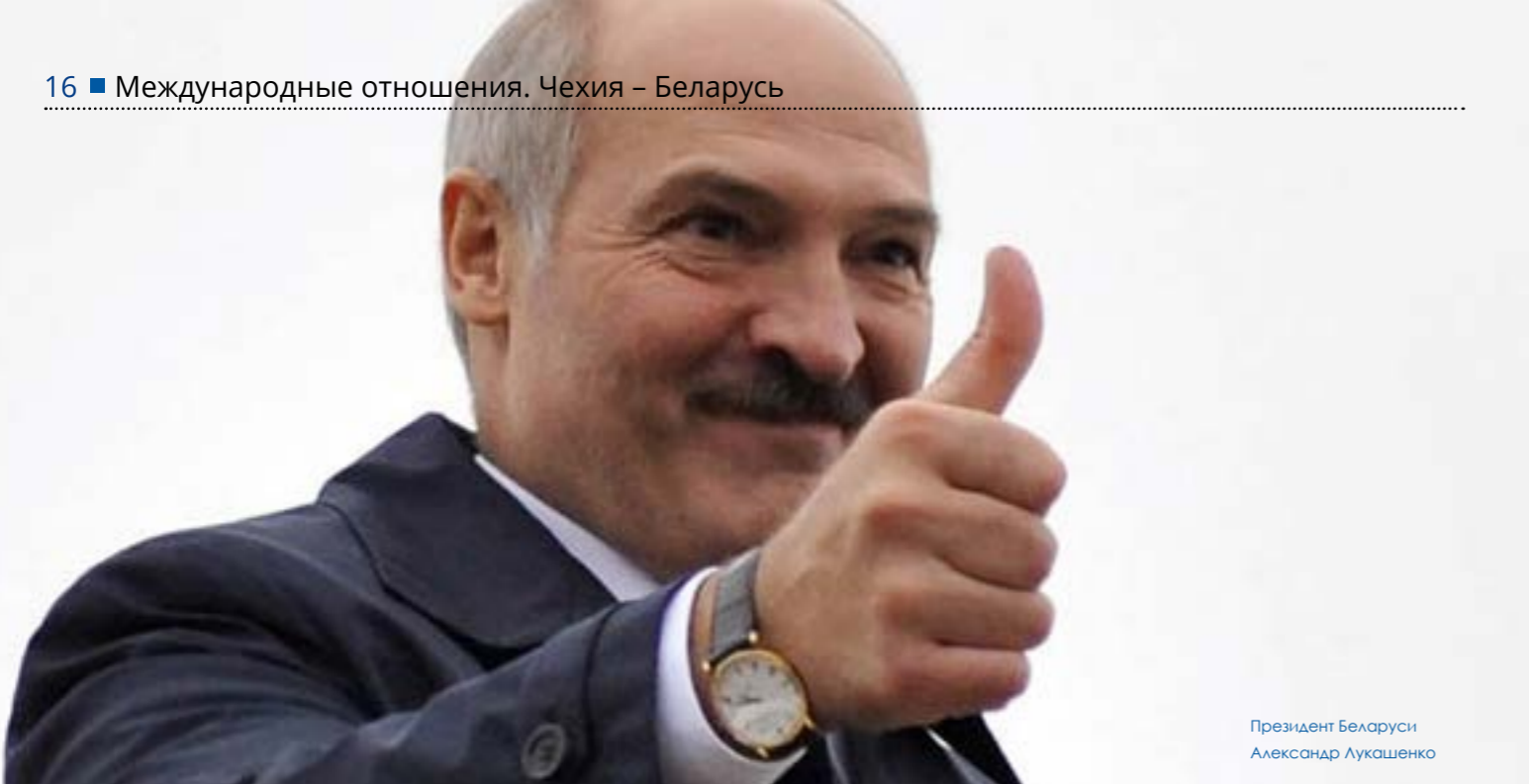
Президент Беларуси Александр Лукашенко