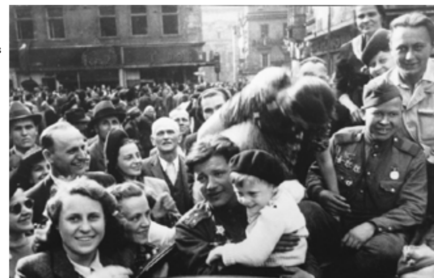
Освобождение Праги советскими войсками в 1945 году