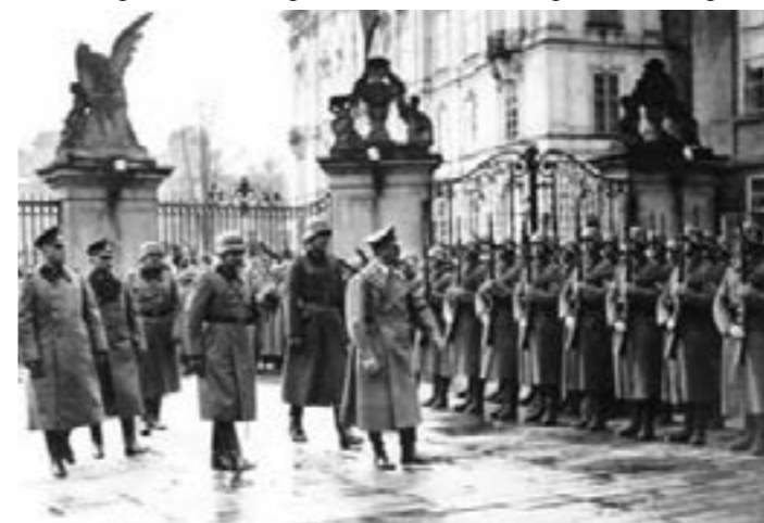
Гитлер в Пражском Граде 15 марта 1939 года

После создания протектората все чехословацкие евреи были изгнаны с государственной службы. 27 июля 1939 года в Праге было открыто отделение Центрального бюро