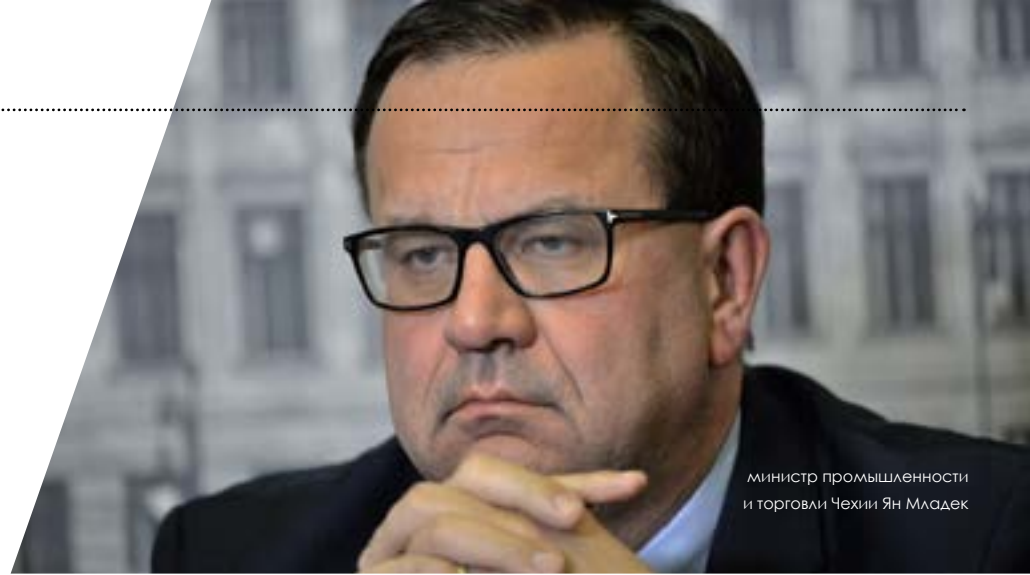
министр промышленности и торговли Чехии Ян Младак

Jan Mládek: Rusko bylo pro naši zemi vždy důležitým trhem