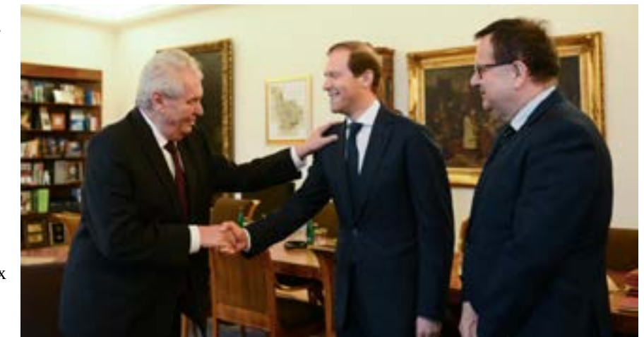
Встреча президента Чехии и Яна Младака с Денисом Мантуровым, 22 марта 2016 года

Ruský ministr konstatoval velký význam činnosti mezivládní komise, v rámci její pracovní skupiny se zpracovává řada nových