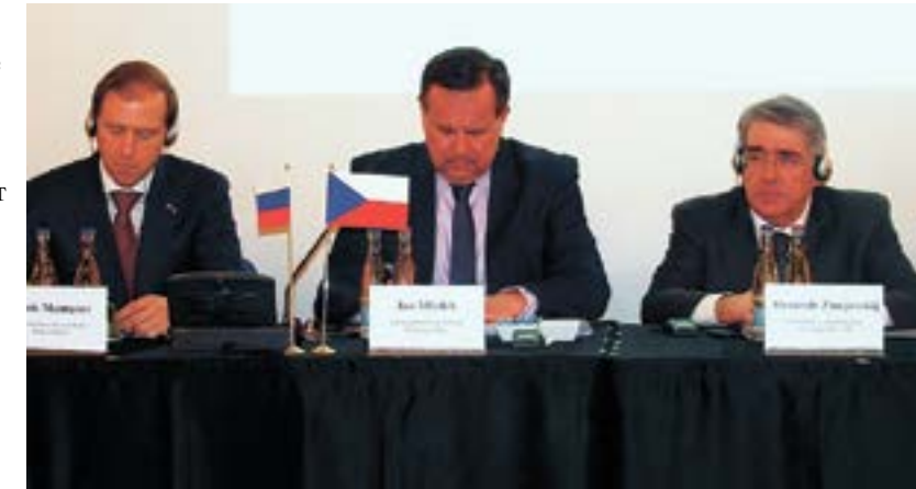
Заседание межправительственной комиссии, март 2016 г.

Российский министр отметил большое значение деятельности межправительственной комиссии, в рамках рабочей группы которой прорабатывается ряд новых совместных проектов в промышленности, объем совместных инвестиций по которым, по предварительным оценкам, превышает 500 млн евро. Так, в области станкостроения в качестве примера эффективного сотрудничества была названа компания «КОВОСВИТ». Расширяется модельный ряд и выпуск в России машин чешской компании Škoda, которая имеет российскую производственную базу в Калуге и Нижнем Новгороде и завоевывает позиции лидера в самом востребованном потребительском сегменте. Большое внимание на встрече было уделено также и российско-чешскому сотрудничеству в атомной энергетике, которое имеет долгую и успешную историю. В частности, обсуждались работы по контрактным обязательствам российской компании «Атомстройэкспорт» в части научно-технической поддержки эксплуатации чешских атомных электростанций.