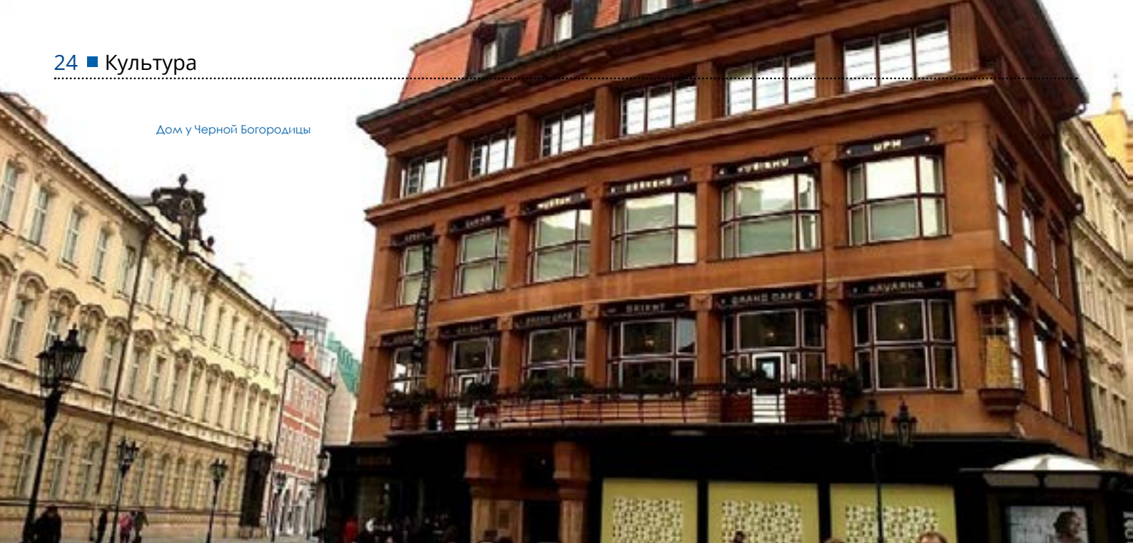
Дом у Черной Богородицы