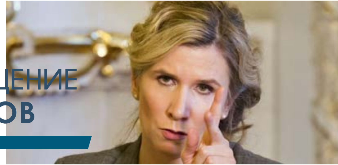
министр образования Чехии Катержина Валахова

«Мы собираемся вернуть то, что давно задолжали родителям и детям» - эта недавняя фраза министра образования Чехии Катержины Валаховой в буквальном смысле всколыхнула общественность и вызвала бурю эмоций. Речь идет о реформировании закона об «инклюзивном обучении»