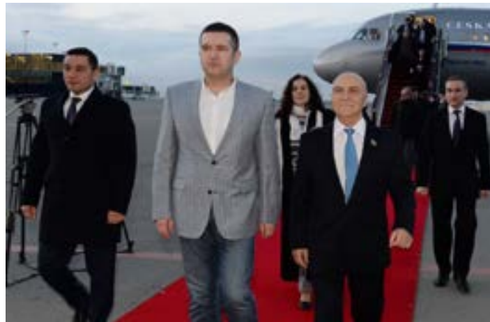
Ян Гамачек в Баку

В беседе с журналистами Ян Гамачек выразил удовлетворение очередным визитом в Азербайджан. Он сообщил, что Чехия была и остается партнером Азербайджана во многих сферах.