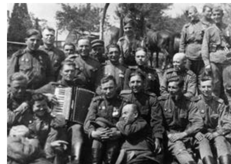
С взятием Брно советское командование связывало крупные стратегические планы. Красная Армия получала возможность широкого маневра по разгрому оставшихся вражеских сил. Так 2-й Украинский фронт мог выйти во фланг и тыл 1-й немецкой танковой армии в районе Оломоуца и во взаимодействии с войсками 4-го Украинского фронта уничтожить её. А главное, с захватом Брно, открывался прямой путь на Прагу.

Город Брно решили взять подвижными танковыми и кавалерийскими соединениями в сочетании с фронтальным наступлением общевойсковых соединений. 16 апреля, после победного завершения Венской операции, Малиновскому вернули 6-ю гвардейскую танковую армию Кравченко. Решающую роль в операции по взятию Брно должны были сыграть 53-я армия Манагарова, 6-я гвардейская танковая армия Кравченко и гвардейская конно-механизированная группа Плиева. Эти соединения составили ударную группировку фронта. Армия Манагарова была усилена двумя стрелковыми корпусами — 18-м гвардейским и 50-м стрелковыми корпусами, в 1-ю гвардейскую КМГ Плиева включили 7-й механизированный корпус. Танковую армию Кравченко укрепили 2-м гвардейским механизированным корпусом и 83-й бригадой морской пехоты.