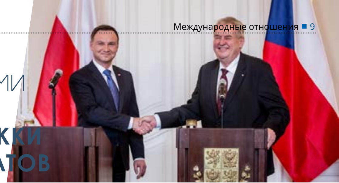
Анжей Дуда и Милош Земан