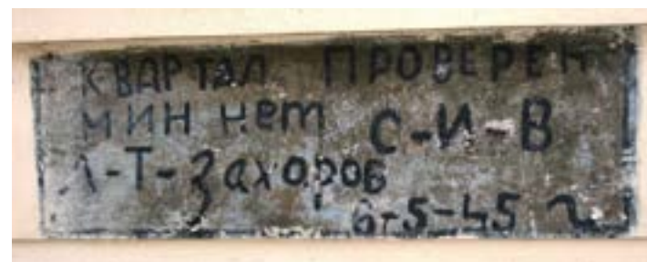
Брно – Вевержи

На Центральном кладбище Брно захоронены свыше 3,5 тысяч советских солдат.