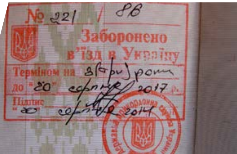
Штамп о запрете на въезд в Украину после незаконного, по ее нормам, посещения Крыма

В марте 2014 года в Крыму прошел референдум, после которого Россия объявила полуостров своей территорией. Украина и многие страны Запада назвали референдум незаконным. Александр Лукашенко заявил, что Крым «де-факто российский».