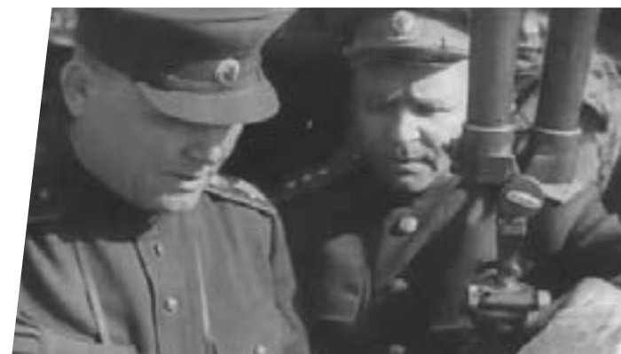
Войска 2-го Украинского фронта в освобожденном городе Брно

Гитлеровцы засуетились, пытаясь организовать сопротивление. Вскоре они открыли беспорядочный огонь из пушек, пулеметов и автоматов. Но их стрельба в темноту, по невидимым целям была бесполезной. А тем временем наши скорострельные зенитки не умолкая били по освещенным горящим машинам. Снаряды точно ложились в цель. Вот вспыхнул средний танк. Гитлеровцы стали бросать орудия, экипажи выскакивали из машин и разбегались в разные стороны. Крики и стоны раненых доносились до батарей. Врага охватила паника» (из воспоминаний Генерал-полковника Плиева И. А.).